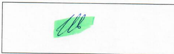
Личная подпись водителя

Примечание: подпись должна иметь четкие, хорошо различимые линии, ставиться черными чернилами, занимать 80% выделенной области и не выходить за пределы рамки.